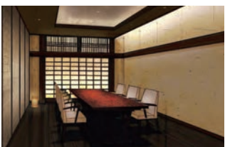
プレミアムダイニング「雲珠」 懐石料理を最高の状態で召し上がって いただけるあたま石亭の食の空間です。 230坪の空間に、プライベートに食事の 時間を楽しめる大小11室の個室と、開放 的で優雅な時間が流れるメインダイニ ングホールを備えています。