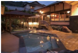
古民家を移築した野趣溢れる こり殿方用露天風呂 古狸の湯