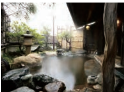
貸切り露天風呂「今井浜」