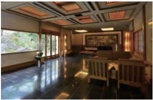
開放的でシックな空気が漂うロビー。ご到着、ご出 発時だけでなく、いつでもお過ごしください。